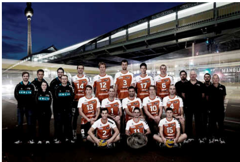
Die BR Volleys haben in Berlin die Wahl zur Mannschaft des Jahres gewonnen. Für die Volleyballer ist es die erste Auszeichnung überhaupt

Es war ein erfolgreiches Jahr für die Berliner Spitzenclubs: HERTHA BSC schaffte den Wiederaufstieg in die Fußball-Bundesliga, der 1. FC UNION hat gute Chancen dem Stadtrivalen bald zu folgen, die EISBÄREN verteidigten eindrucksvoll ihren Eishockey-Meistertitel, ALBA gewann den Basketball-Pokal und die FÜCHSE etablierten sich endgültig in der Spitze der stärksten Handball-Liga der Welt. Allein schon die Nominierung bei der Sportlerwahl CHAMPIONS 2013 war eine große Ehre für die BR Volleys. Doch damit nicht genug, gestern Abend wurden die Berliner Volleyballer im Rahmen der feierlichen Preisvergabe als „Mannschaft des Jahres 2013“ ausgezeichnet!